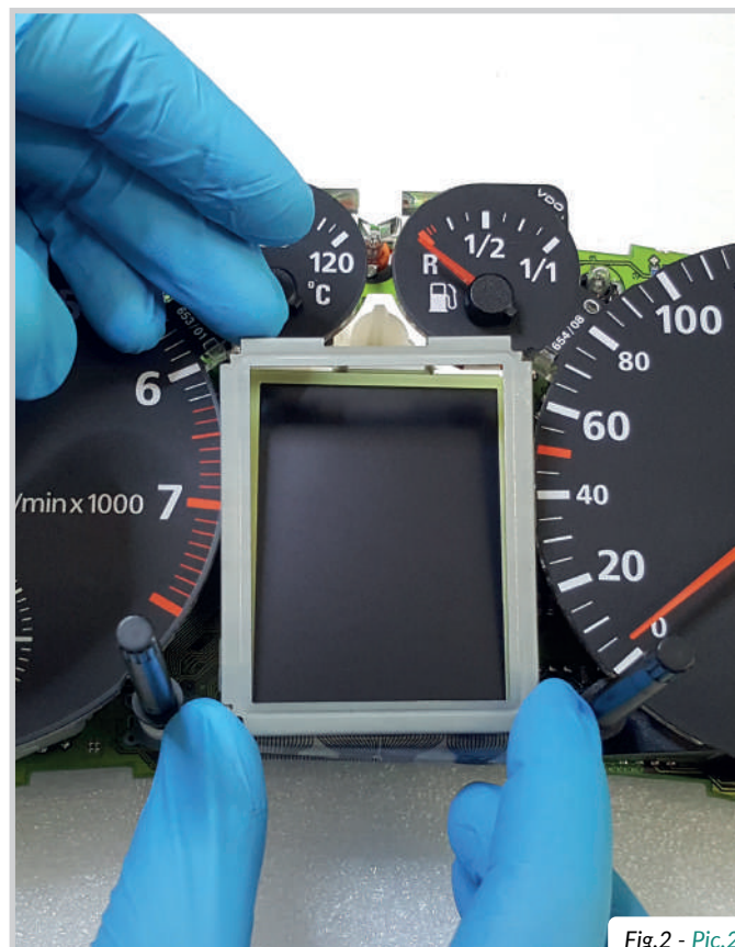
Fig.2 - Pic.2

Fit the display on its base and position the frame supplied with the kit as in picture 1. Lastly, overlap the original metal frame as in picture 2.