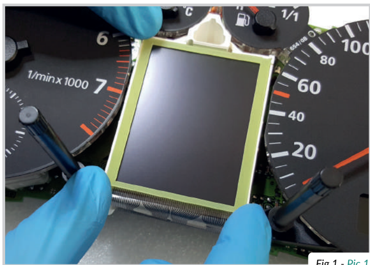
Fig.1 - Pic.1

Saldare il flat del nuovo display sul PCB del quadro strumenti con un saldatore con punta a "T" a 350° C. Seal the flat cable of the new display on the PCB of the instrument cluster with a soldering iron with "T" tip at 350° C.